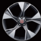
20" 5辐 亮光灰撞色钻石切割 铝合金轮毂-样式5102