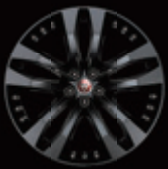
20" 5辐 亮黑铝合金轮毂 -样式5039