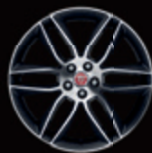
20" 6辐 亮光深灰撞色钻石切割 铝合金轮毂-样式6003