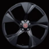
20" 5辐 亮黑铝合金轮毂 -样式5102