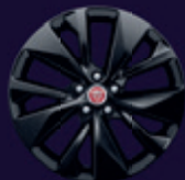
19英寸5辐亮黑色铝合金轮毂 - 样式5106