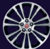
19英寸7辐钻石切割铝合金轮毂 - 样式7013