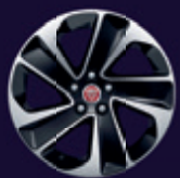
18英寸5辐钻石切割铝合金轮毂 - 样式5105