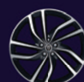
20英寸5辐钻石切割铝合金轮毂 - 样式5036

注1: S表示该装备为标准配置;NA表示该装备不提供选装; O表示该装备为选装单件; P表示该装备为选装包;(O)表示该装备为关联配置